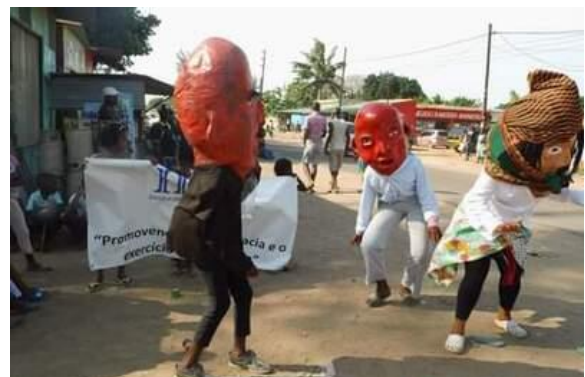
Imagem 9: Uso de marionete para arte