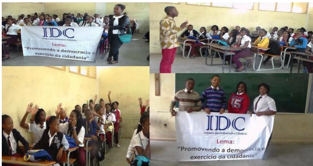
Imagem 1: Escola Secundária da Matola