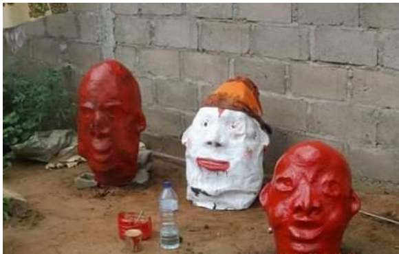
Imagem 8: Produção de marionetes

... produziu-se alguns artigos de arte com destaque para “marionetes”: