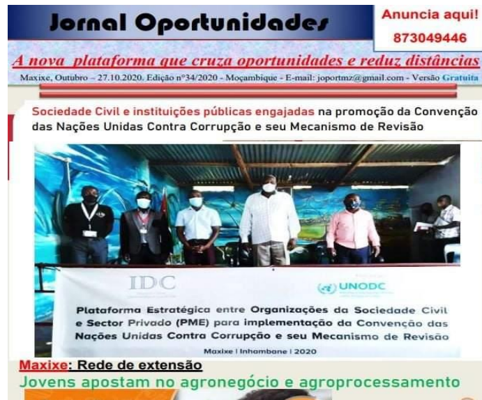
Imagem 12: Cobertura jornalística da cerimónia de lançamento da plataforma