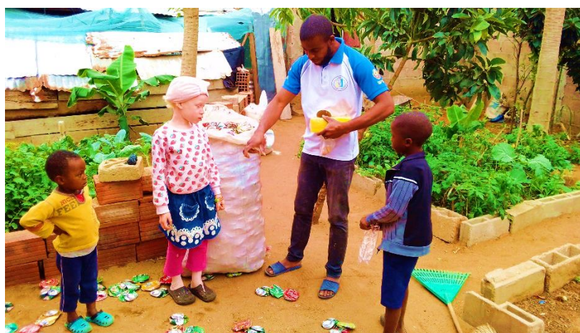
Imagem 10: instrução para recolha de latas de alumínio

Ainda no contexto da sensibilização das comunidades para a preservação do meio ambiente, ao longo deste período teve lugar a introdução da iniciativa que visa instruir crianças e adolescentes para recolha de latas de alumínio, uma iniciativa que para além de ajudar a limpar o ambiente, igualmente pode constituir fonte de renda para adultos. Mas tratando-se de uma idade não permitida por lei para o exercício de actividade remunerada, a iniciativa consiste na distribuição de incentivos aos actores envolvidos (crianças e adolescentes), de acordo a imagem que se segue: