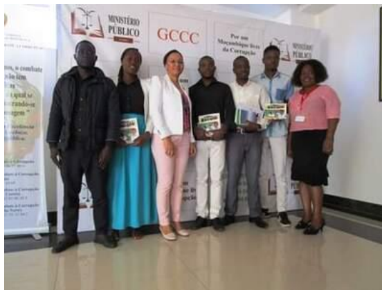
Imagem 2: Formação de formadores da sociedade civil sobre prevenção e combate a corrupção

O treinamento esteve voltado para diversos temas relevantes, com destaque para (a) o papel das organizações da sociedade civil (OSC) na prevenção e combate à corrupção, (b) técnicas básicas de comunicação para a mudança. (c) conceitos, tipologia, causas e consequências da corrupção e (d) canais de denúncia de crimes de corrupção.