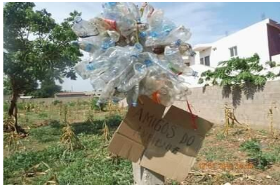
Imagem 7: Sobre garrafas plásticas e papelão

... produziu-se alguns artigos de arte com destaque para “marionetes”: