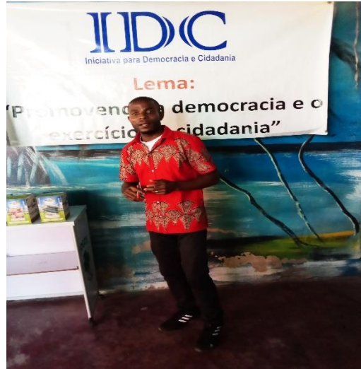
Imagem 11 : Realização de sessão virtual