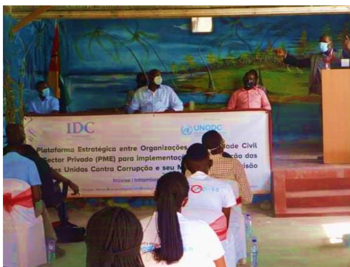
Imagem 3: lançamento oficial do projecto de estabelecimento para parceria estratégica entre sociedade civil e sector privado para implementação da UNCAC

A implementação deste projeto consolida a efetivação da necessidade de reunir os actores relevantes envolvidos no combate à corrupção, para que estejam conectados e tenham o mesmo foco da UNCAC. A iniciativa visava contribuir para maior envolvimento do sector privado no combate à corrupção em coordenação com Organizações da Sociedade Civil, conforme ilustra a imagem 3, a seguir: