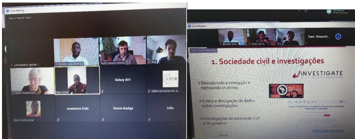
Imagens 5 e 4: sessão virtual de capacitação sobre a recuperação de activos, organizada pela CIFAR

Por iniciativa da IDC houve espaço para realização de sessões de treinamento e capacitação com recurso a plataformas digitais.